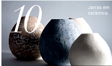
Jarras em cerâmica