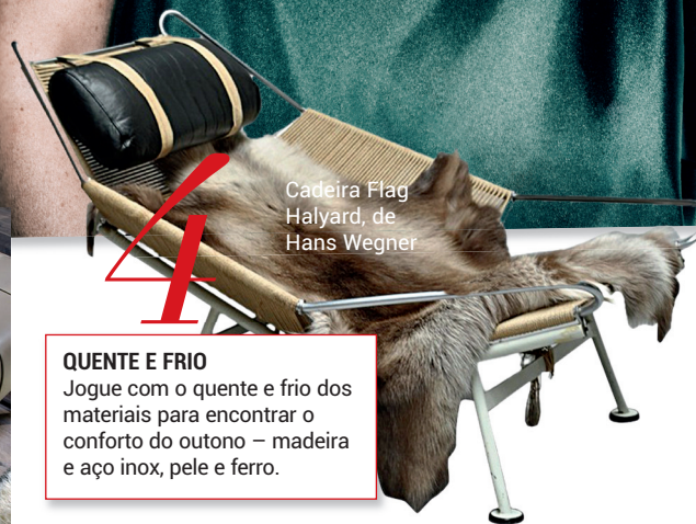
Cadeira Flág Halyard, de Hans Wegner