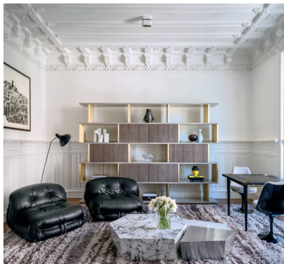
O interior do espaço CJC Home

Aposte em jarras vintage em vidro texturizado ou em porcelana pintada – são apontamentos de design que complementam qualquer espaço, adaptando-se a diferentes estilos decorativos.